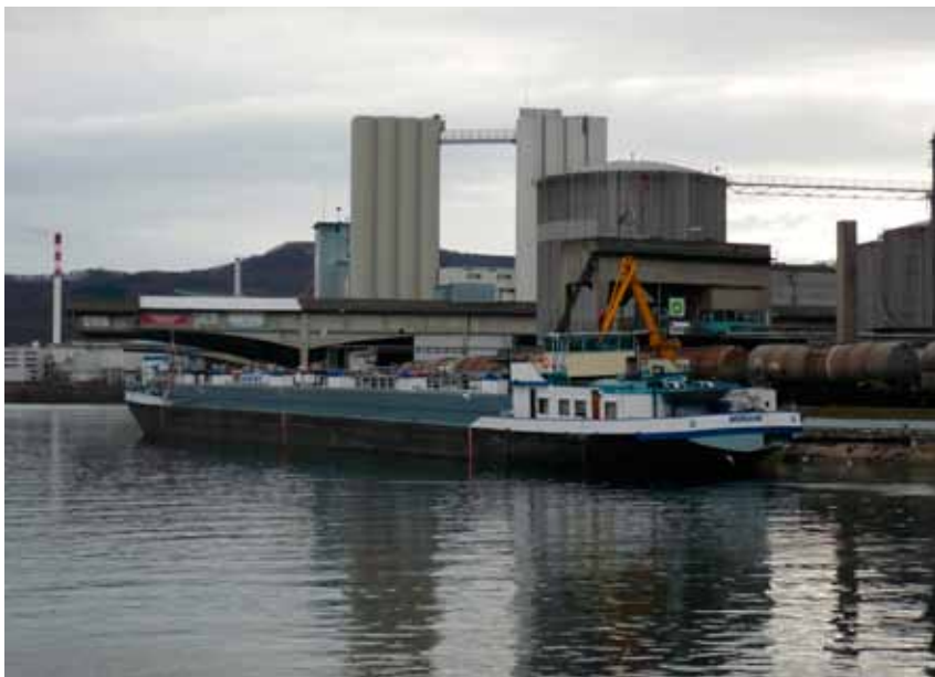
Das Weissbuch enthält zwar viel Wertschätzung der Binnenschifffahrt, jedoch keine Ansätze zur Realisierung dringend notwendiger Infrastrukturmassnahmen.

Binnenwasserstrassen sollen im europäischen Verkehrssystem zukünftig eine stärkere Position einnehmen, besonders beim Gütertransport in das Hinterland und bei der Verknüpfung der europäischen Meere. Die Kommission betont das Erfordernis effizienter Seehafenhinterlandverbindungen und spricht deren Ausbau für die Bewältigung eines gestiegenen Frachtaufkommens eine grundlegende Bedeu-