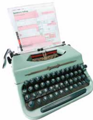
Diese Zeiten gehören mit DATACENTER endgültig der Vergangenheit an.

Kunden, welche bereits Daten in einer Form zur Verfügung stellen (EDI-direct) können sich einmalig registrieren (Kosten CHF 120.-) und mit einer jährlichen Gebühr von CHF 120.- ihre Daten über unser DATACENTER versenden. Eine allfällig notwendige Anpassung und Schnittstelle wird separat verrechnet und