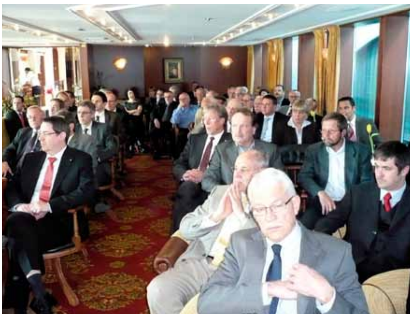
Mit über 140 Personen konnte an der SVS-GV 2011 Rekord-Teilnehmerzahl verzeichnet werden.

Auch «Niederlagen» musste der Referent erwähnen. Eine solche Niederlage sei zweifellos die Ablehnung der Motion Janiak durch den Nationalrat, trotz grossem Einsatz von SVS und SRH um jede Stimme in der Grossen Kammer. Aber auch hier sei das Positive herauszustreichen: «Die Güterschifffahrt auf dem Rhein war auf Tagesordnung in Bern, die Kammern haben darüber diskutiert und sich mit diesem Verkehrsträger intensiv beschäftigt. Dies – und die vielen Kontakte, die wir beim Werben um den Vorstoss knüpfen konnten – werden uns bei einem nächsten Anlauf nützlich und gewinnbringend sein. Und wir werden – gemeinsam mit den Schweizerischen Rheinhäfen – zweifellos weitere Anläufe in diese Richtung nehmen – weil diese Richtung die richtige ist.»